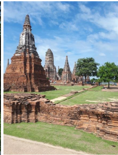
Kokos na plaži na otoku Phangan; rajska plaža na Phuketu; Ayutthaya, nekdanja prestolnica Siam