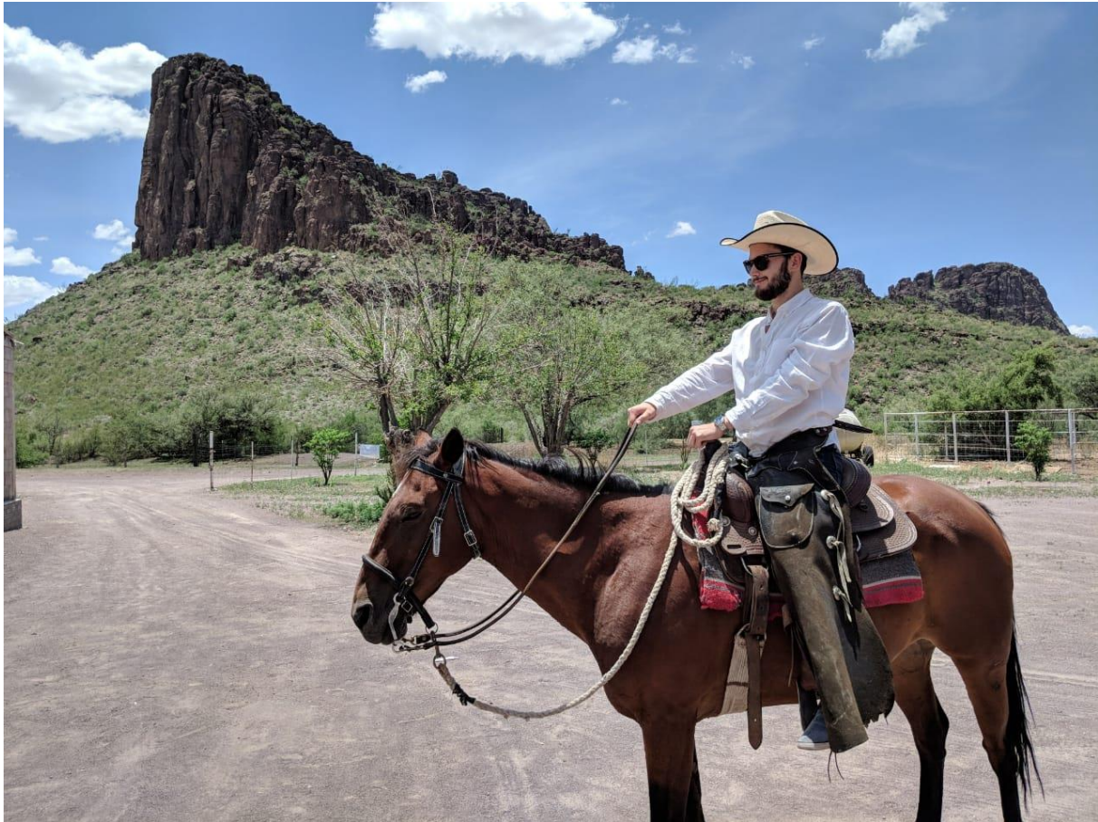
Življenje na ranču.