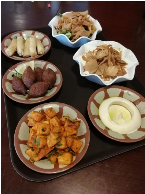
Slika 1 Libanonske meze

V Makassed bolnišnici nam je pripadal en obrok na dan, zajtrk ali kosilo. Kosilo je bilo vedno ena pripravljena jed ali pa potem razni sendviči, solate... težava je bila, da nihče v menzi ni govoril angleško, tako da je trajalo kar dolgo, da se dogovoriš kaj bi jedel. Največ težav sem imela sama, ker ne jem mesa, tista ena jed za kosilo, pa je vedno vsebovala meat ali chicken (oni to smešno ločijo, torej vegetarijanci pozor, no meat še ne pomeni, da jed mogoče ne vsebuje piščanca haha). Je pa ta obrok zastoj in sendviči so bili res odlični.