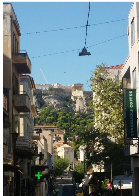
Slika 5: Akropola z Atenskih ulic

V sklopu lokalnega socialnega programa je bil s strani organizacije organiziran Upon Arrival Meeting in National Food and Drink Party in National Karaoke Night. Za ostala druženja smo po večini dajali pobudo sami, CPji pa so nam bolj ali manj pomagali. Med vikendi je bil organiziran National Social Programme, na katerega smo se prijaviли že pred izmenjavo in ker je bil interes prevelik, je potekalo žrebanje za posamezne vikende. Prijavila sem se na dva vikenda, na koncu pa dobila le vikend v Atenah, za katerega