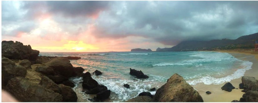
Slika 7: Falasarna