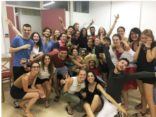
Slika 3: Incomingsi z ekipo izmenjav

V Heraklion sem prišla nekaj dni prej uradnim začetkom izmenjave. Na letališču me je pričakala moja kontaktna oseba in me pospremila do stanovanja enega od študentov, kjer sem preživela prve dni, kasneje pa sem se preselila v študentski dom. Pomagal mi je tudi prvi dan v bolnišnici, kjer mi je razkazal bolnišnico in okolico ter me je pospremil do oddelka. Predstojnika in mentorje sem poiskala sama, ob priliki.