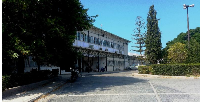
Slika 4: Študentski dom

Na voljo nam je bila tudi dnevna soba in v pritličju soba za žure 😊. Čistoča je zadovoljiva, primerljiva z našimi študentskimi domovi in najbolj odvisna od ljudi, s katerimi si deliš prostore, kuhinjo 2x na teden pride počistiti tudi čistilka, toaletne prostore in sobo pa čistiš sam.