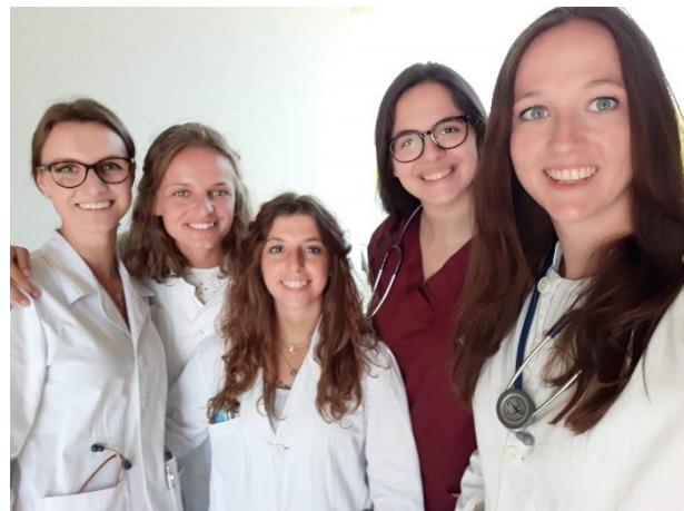
Slika 6: Študentska ekipa internega oddelka