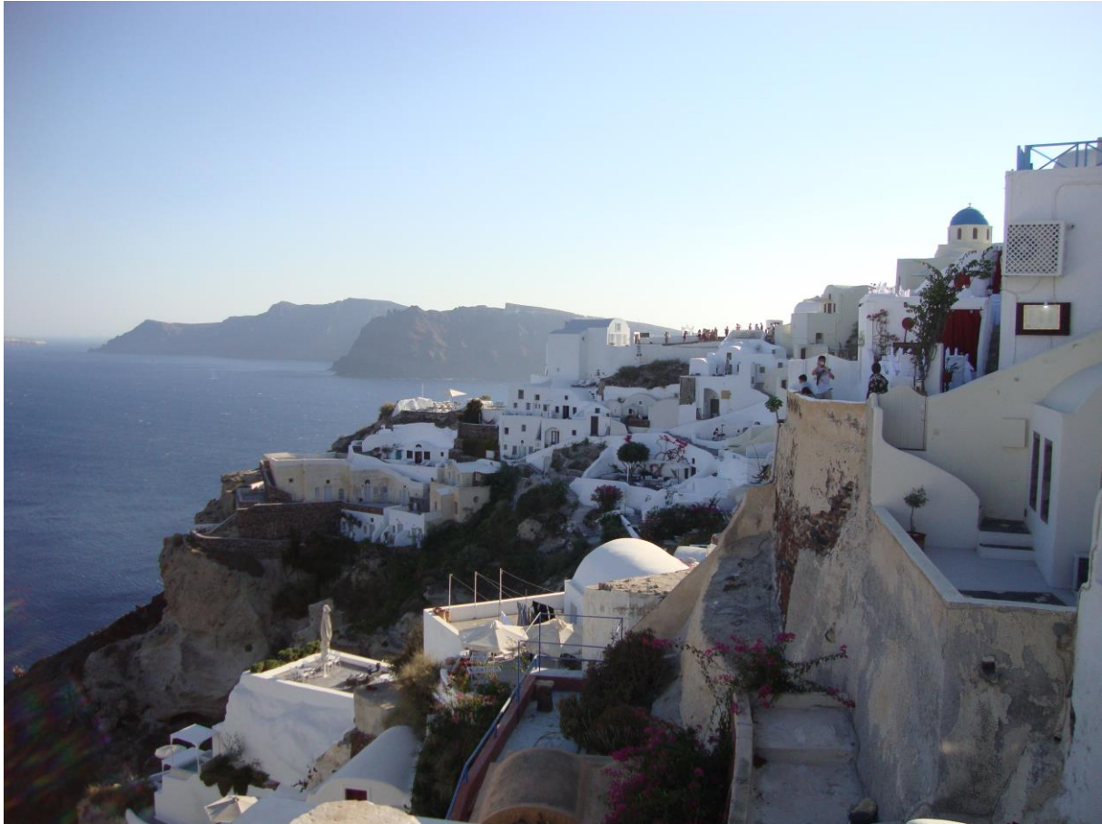
Pogled iz restavracije na Santoriniju (mesto Oia)

preko interneta, saj agencije lahko obljubijo popust, ki ga posamezni prevozniki ponujajo le za grške študente (ne pa za vse študente iz EU).