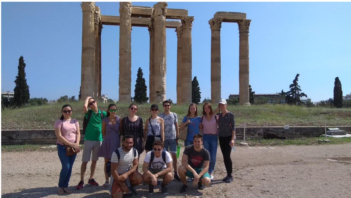
Skupaj z nekaterimi novimi prijatelji na ogledu Zevsovega templja

Letalska karta 224€, Santorini 240€, los 200€, Agistri 20€, vstopnine: 2,5€ (ostalo je bilo brezplačno za študente iz EU), avtobus Delfi 24€, avtobus rt Sounion 10€, mesečna karta za javni prevoz po Atenah 15€, nekaj denarja za hrano.