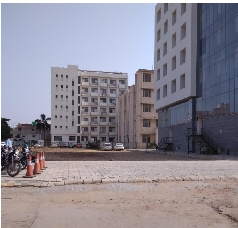
novozgrajen ženski hostel