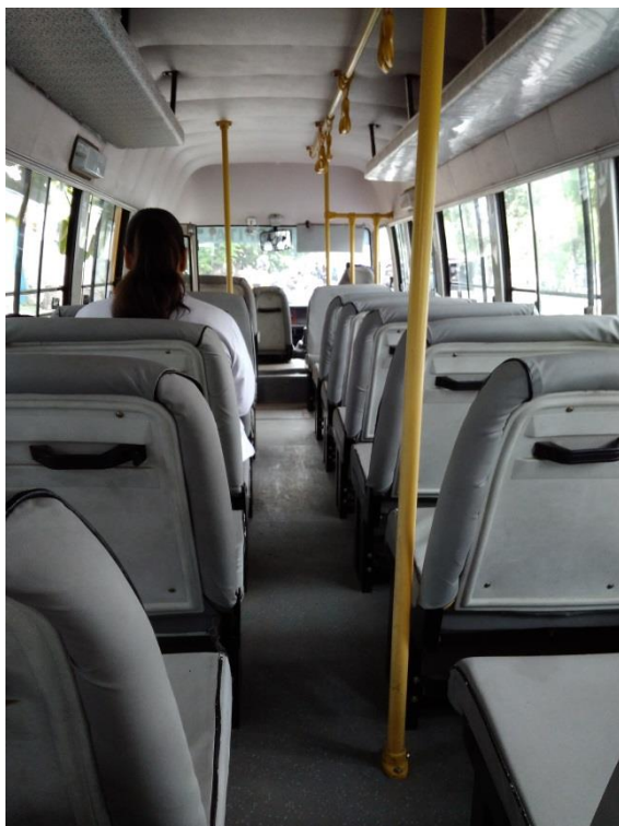
brezplačen avtobus na poti v bolnico, namenjen le študentom