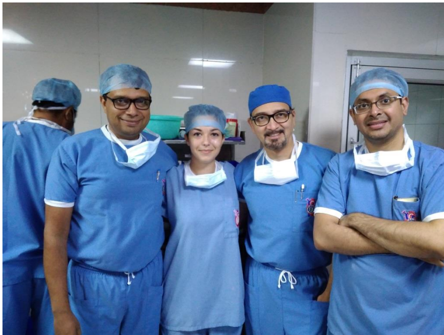
del ekipe; anesteziolog in kardiokirurgja