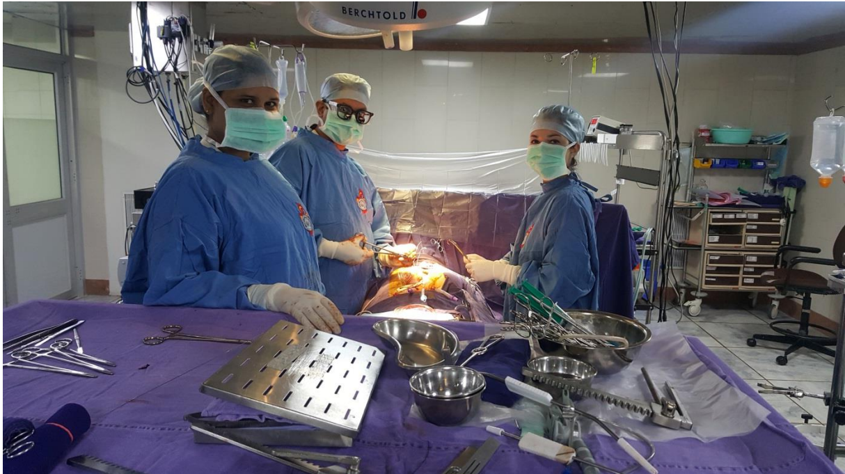
asistiranje pri CABG