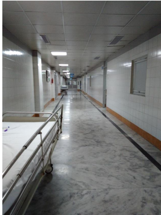
hodnik na kardiotorakalni kirurgiji