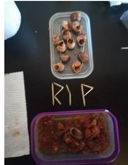
Slika 4: "Pa zakaj si tako pomehkužen?"- "Stari, polž sem!" Bon appetit!

LEOta sta se odločila, da nam ne bosta nakupila kosil v menzi bolnišnice, ker se jima ni zdelo smiselno, pa čeprav se kar nekaj tujih študentov z njima glede tega nismo strinjali. Hrano sem si kupovala sama, en teden sem si nakupila tudi kosila v menzi, drugače sem si večinoma kuhala kosila v stanovanju oz. nekajkrat privoščila večerjo v restavraciji in menzah s hitro hrano. Od lokalne IFMSA sem imela na razpolago 170€, ki jih lahko porabim za hrano. Ob koncu izmenjave smo z gostiteljico vse račune preštete in mi je vrnila vsa denar, ki sem ga dala za hrano. Zdi se mi primeren budget za mesec dni bivanja. Cena kosil v bolnišnični menzi za 5 dni v tednu je bila 27€, vendar sem si večinoma raje sama kuhala.