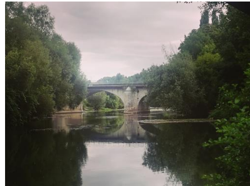
Slika 1: Pont neuf v Poitiersu, ne gre za deveti most in niti ne tako nov most, ampak če ga pogledaš od daleč vidiš marsikaj. V odsevu ...

Poitiers je manjše mesto, ki leži na zahodu Francije v regiji Poitou-Charantes. Velik del prebivalcev so študentje, ki pa so v mesecu avgustu večinoma počitnikovali, zato je bilo mesto do sredine avgusta kar prazno. Mesto ima svoje staro središče, ne toliko daleč od glavne reke z imenom Le Clain. Center mesta se ponaša z lepimi starejšimi zgradbami, predvsem mestnim trgom z mestno hišo, ozkimi srednjeveškimi ulicami in številnimi cerkvami. Najbolj prijetni sprehodi po mestu so preko njegovega središča, kjer lahko izbirate vse od odličnih restavracij s francosko kuhinjo do študentskem žepu prijaznejših barov in bistrojev s hitro hrano. Če vam je bolj pri srcu narava, pa je sprehod skozi drevored lip v prisrčnem mestnem parku ali ob bregu reke, pomirjujoča sprostitev. Ob koncu sončnega in jasnega dne pa se je vsekakor vredno povzpeti po stopnicah na vrh hribčka, kjer lahko z razgledne točke v tišini občudujete sončni zahod nad zaspanim mestom in si oddahnete v tišini.