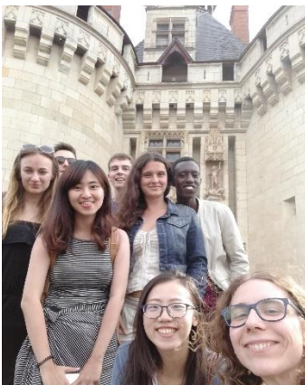
Slika 5: Skupinska slika z izleta do jezera. Ustavili smo se tudi pred našo vikend hiško.

Socialnega programa v Poitiersu nismo imeli veliko organiziranega s strani LEOTov. Kar sta organizirala je bil NFDP kosilo, eno srečanje na pijači v mestu in poldnevni izlet do bližnjega jezera. Na srečo pa so na preskrbeli z raznoraznimi prospekti dogajanj v mestu in drugimi turističnimi prospekti o pokrajini tako, da smo si deloma lahko omagali tudi s tem in sem si prosti večinoma organizirala sama. Popoldneve in večere v prvem tednu sem preživljala v družbi francoskih prijateljev, sošolcev in sošolk moje gostiteljice, kasneje pa v družbi ostalih tujih študentov. V »Downtownu« Poitiersa je veliko raznovrstnih barov in pubov tako, da je bila izbira za večerna druženja pestra, en večer smo si privoščili tudi ogled