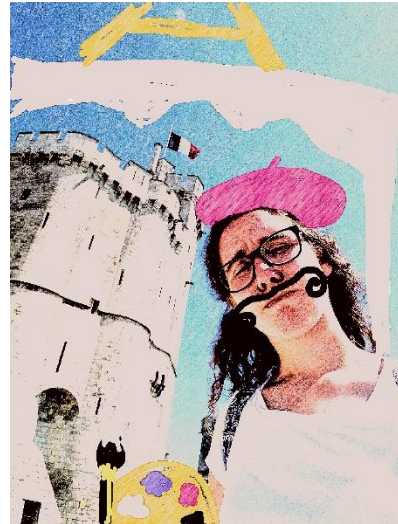
Slika 3: Tako se pa lahko "delaš francoza". Nariši nov dan, s soncem obsijan ...

Dva meseca pred začetkom izmenjave sem kontaktirala svojo gostiteljico prek e-pošte. Prvi odgovor sem dobila hitro in tudi nadaljna komunikacija se je hitro razvijala. Na vsa moja vprašanja sem dobila odgovor od gostiteljice. LEOta iz Poitiersa sta me kontaktirala v zadnjem tednu zato, ker sem pozabila oz. nisem vedela, da je RTG pc obvezen za prijavo na izmenjavo, saj namreč ni bil napisan pod obvezne ampak dodatne dokumente. Zdi se mi, da delo tamkajšnjih LEOtov ni bilo najbolje in odgovorno opravljeno, saj tudi naši francoski gostitelji niso bili popolnoma informirani.