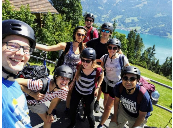
Slika 4 Organiziran sobotni izlet na Niederhorn

Drugega socialnega programa tekom meseca ni bilo, zato sva se s kolegom na izmenjavi kdaj sama dobila na pijači. Med vikendi pa sem sama odšla na izlete po Švici.