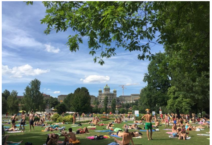
Slika 1 Kopaljšče Marzilli s pogledom na parlament

Bern, glavno mesto Švice, je veliko za pol Ljubljane in zato dobro obvladljivo tudi peš. Skozi mesto teče reka Aare, v kateri se domačini v poletnih mesecih radi osvežijo – Aareschwimmen – do reke je prost dostop pri Marzilli Bad ali Lorraine Bad. Še ena znamenitost mesta je Bärengraben, kjer domujejo trije medvedi, ki so zaščitni znak mesta, saj so nenazadnje tudi v grbu kantona Bern. Nad mestom se dviga hrib po imenu