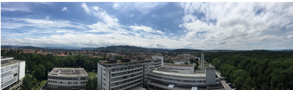
Slika 3 Lindenhofspittal s pogledom na Bern

Prakso sem opravljala na oddelku abdominalne kirurgije v Lindenhof Spittal. To je privatna bolnišnica, ki pa sprejema tudi bolnike z osnovnim zavarovanjem. Ker je Inselspittal večja bolnica oni prevzamejo večino urgentnih primerov, tako da se v Lindenhof opravljajo bolj elektivne operacije. Moj delavnik se je pričel ob 8h, končevala sem ob 18h, kdaj tudi kasneje. Švicarji delajo vsaj 50 ur na teden, tako da se tudi od študentov pričakuje, da delajo 10h na dan. Ob ponedeljkih in sredah je bil čas ambulate (Sprechstunde), kjer sem opazovala delo mentorja, včasih sem naredila kakšen status. Ob torkih, četrtek in petkih so bile na programu operacije. Pri vseh operacijah, ki smo jih imeli, sem lahko asistirala, med operacijo mi je mentor postavljala veliko anatomske vprašanja. Delali smo veliko bariatričnih operacij, resekcije debelega črevesa, apendektomije, holecistektomije, ileo-stome... Kot IFMSA študent tam opravljaš isto delo kot švicarski študentje v njihovem 6. Letniku ( Wahljahrstudent ), zato se od tebe pričakuje in zahteva, da tam res delaš in ne samo opazuješ!