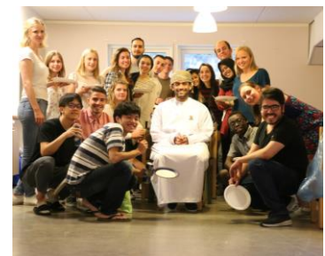
Slika 3: Velika družina na NFD.