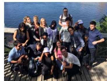
Slika 4: Izlet v Stockholm.