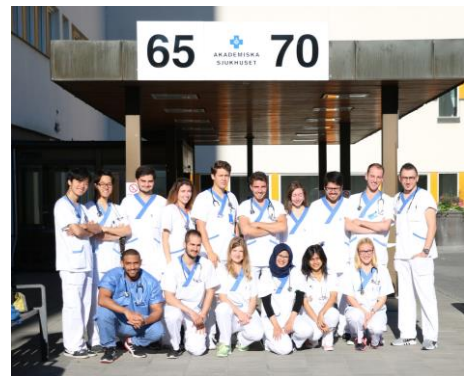
Slika 1: Skupinska slika pred bolnišnico.

Prakso sem opravljala na oddelku za anesteziologijo v bolnišnici Akademiska Sjukhuset v Uppsali. To je bila moja druga izbira (prva je bila nevrologija), vendar sem zelo vesela, da sem se поблиže spoznala z vejo medicine, ki je v slovenskem programu študija skorajda ni. Specializacija anesteziologije na Švedskem vključuje tudi specializacijo iz intenzivne medicine, zato sem prva dva tedna preživela v operacijskih dvoranah, druga dva pa na oddelku intenzivne medicine.