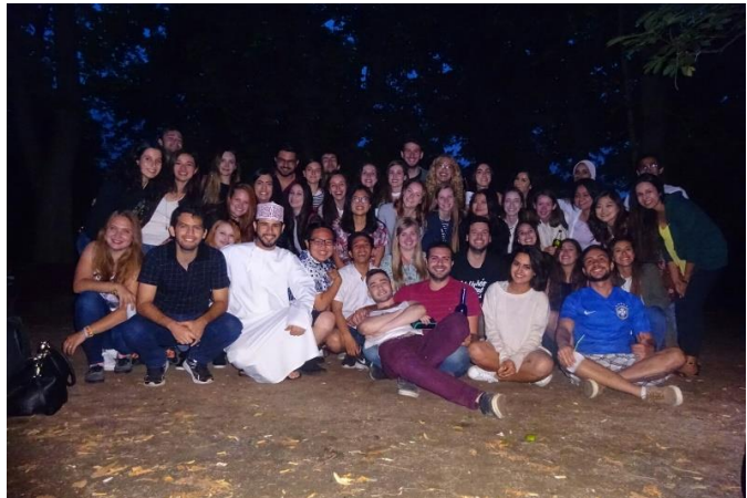
Slika 4: NFDP v enem od parkov

V splošnem sem bila z izmenjavo zelo zadovoljna. Kljub majhnemu razočaranju nad (ne)organizacijo gostiteljev in nekaterimi mentorji v bolnici, sem spoznala ogromno super ljudi s celega sveta, s katerimi smo prehodili vsak koticik Prage in obiskali veliko drugih mest na Češkem ter preživeli nepozaben mesec.