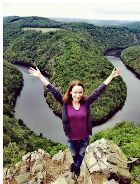
Slika 3: Vyhlička Maj

Kljub temu smo se imeli v prostem času odlično, saj smo si med vikendi sami ogledali veliko večino države, od kulturnih znamenitosti do naravnih parkov. Medmestni prevoz (bus ali