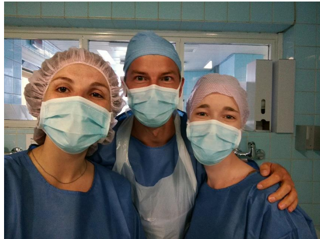
Slika 2: Večino časa sem preživela v operacijski dvorani

dosti zmenili. Nekajkrat sem sicer lahko asistirala pri operaciji, največkrat pa mi niso pustili, saj so raje izkoristili češke moške študente, ki so bili istočasno na vajah. Precejšen problem je bil jezik, saj vsaj polovica zdravnikov ni govorila angleško, še dosti slabše pa je bilo z medicinskimi sestrami. Ko ni bilo operacij, ali pa je bilo na sporedu več istih operacij zapored, sem šla v urgentno ambulanto, kjer so vedno delali mladi specializanti, ki so vsi govorili