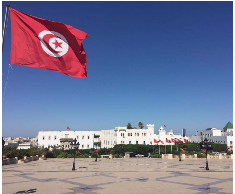
Slika 6 Tunizija