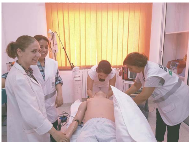
Slika 2 Vaje v simulacijskem centru

Moja prvotna klinična praksa naj bi potekala na kirurškem oddelku, kar so mi spremenili v oddelek urgentne medicine. Izkušnja je bila kljub temu super, naredila sem tudi nekaj nočnih. Na kraj dogodka smo šli z rešilcem, lahko je šlo za prometno nesrečo (tudi veliko alkohola v igri pri Tunizijcih in nora vožnja☺), srčni zastoj ali hipoglikemijo. Če tam preživiš noč dobiš svojo sobo, čisto in z klimo, kar je v