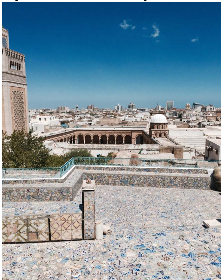
Slika 1 Staro mesto Tunis / medina

Tunis (staro ime Tunes) je pristaniško glavno mesto Tunizije, ki se nahaja ob jezeru Tunis v severovzhodni Tuniziji. Mesto je ločeno na dva dela: staro arabsko jedro, ki ga obkroža obzidje, ter novi, z evropsko arhitekturo zaznamovani del. V starem delu mesta je najti t. i. medino (arabsko staro mesto) z množico ozkih ulic in nešteti trgovinami, še zlasti s tradicionalno trgovsko berbersko robo, kot so preproge, bobni in nakit. Mesto ima 2 milijona prebivalcev, precej pester in razburljiv promet in tipičen arabski pridih. Ljudje so prijazni, pripravljeni pomagati, če se slučajno izgubite ali kaj iščete. Zaželeno je znanje francoščine, vendar se z iznajdljivostjo tudi z angleščino znajdeš. Najbolje govorijo angleško v starem jedru Tunisa, kjer se pogajaš za ceno na ulici. Prodajajo usnje, keramiko preproge. Lepe stvari in tudi ne pretirano drage če znaš barantat.