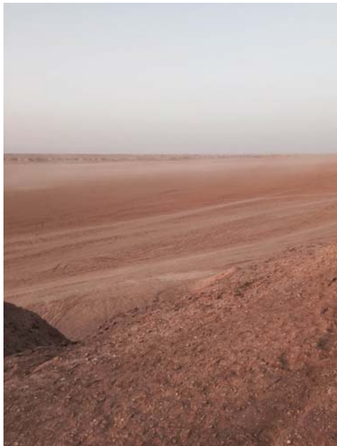
Slika 5 Sahara

S seboj vzamete nujne stvari, za osebno higieno, oblačila itd. Rjuhe in posteljno perilo tudi, blazino za pod glavo, lahko pa vse kupite v bližnjem supermarketu, če imate omejeno prtljago na letalu.