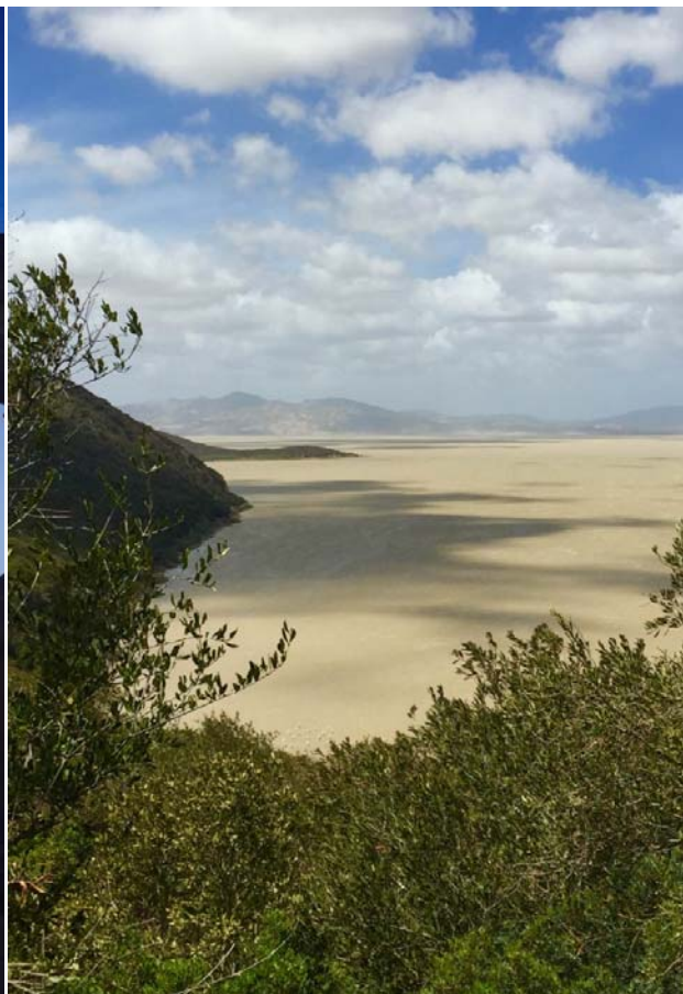
Slika 4 Ichkeul jezero