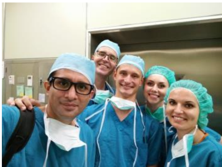
Študentje na plastiki z dvema fellowoma (eden iz Peruja, drug iz Grčije).

Tudi sicer so bili študentje na kirurških oddelkih večinoma zelo zadovoljni – kolega iz ortopedije in travme je bil podobno navdušen, kolega iz kardiokirurgije in kolega iz mafe pa sta bila tudi zadovoljna. Kolegica iz pediatrije pa .. no, ne.