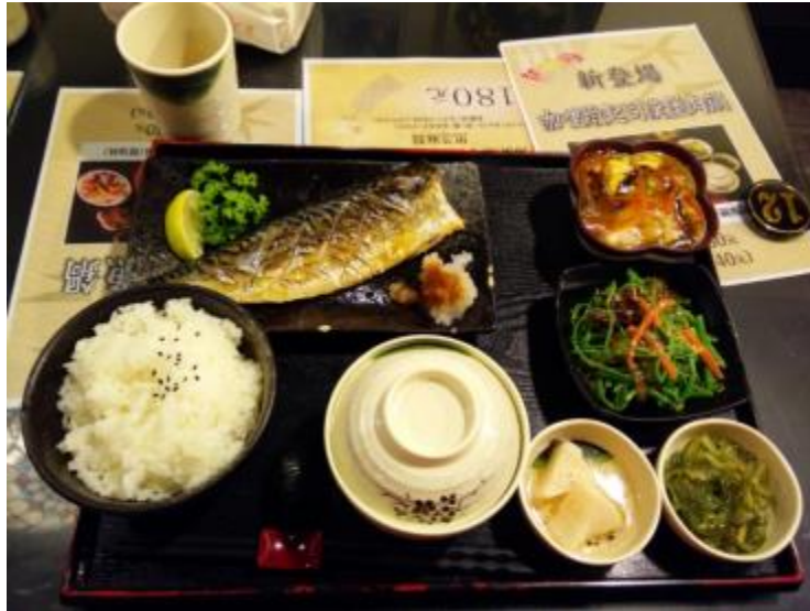
Hrana iz ene izmed "bolj fensi" japonskih restavracij.