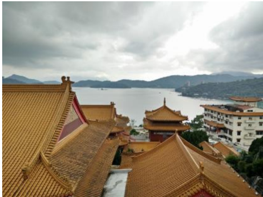
Tempelj ob Sun Moon Lake.