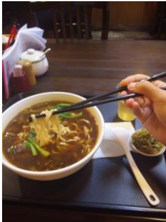
Beef noodles - ena izmed tipičnih tajvanskih jedi. Odlični ;) ("ne-fensi" restavracija)

Hrana je super! Sicer čisto drugačna od tega kar pričakuješ, ampak res fajn. Na Tajvanu (žal?) ne jedo pekoče. Prvi teden se ti želodec privaja na popolnoma drugačno hrano, potem si pa dober. Obrok te načeloma nasiti ravno prav, zelo redko se pa ful nažreš. Načeloma jedo v lokalnih restavracijah, kjer dobiš obrok (razen zajtrk, ki je cenejši) za 60-110 NTD. Bolj fensi ali tuje restavracije imajo obrok za 200-300 NTD, ampak to je že kr precej. Imajo cel kup tradicionalne hrane, ki jo morate poskusiti, zvečer pa obvezno obiščite night market, kjer zraven vseh drugih stvari (bolj značilnih za tržnico) prodajajo tudi gore tajvanske hitre hrane, večinoma ocvrte. To je treba poskusiti tudi, če sicer ne ješ hitre hrane.