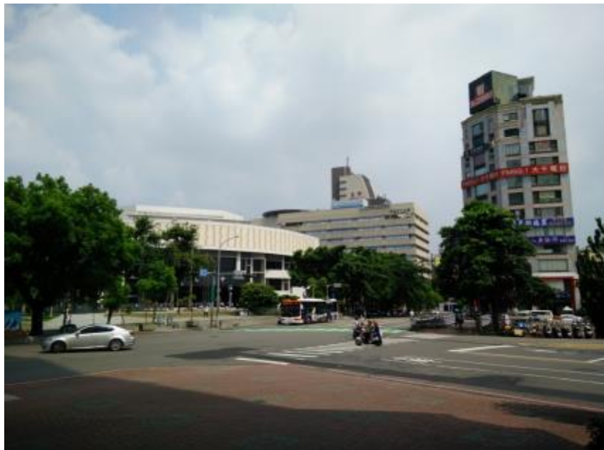
Pogled na Cancer center in urgenco (stolp v ozadju) izpred univerze. Študentski dom je preko ceste desno.

Vse poceni, zajtrk dobiš npr. za 45 NTD (omleto/hamburger (ja, hamburger jedo za zajtrk) + čaj). Torej, dom ima res bolj ali manj vse kar rabiš, ampak je sam očitno star in zato v bolj slabem stanju. Ampak glede na to, da je zastoj, je čisto kul. Edina stvar, ki nas je malo zmotila, so bili ščurki. Vsake toliko te je kak obiskal v sobi ali v skupnem prostoru – naše nadstropje (1.) je bilo najbolj na udaru, ker je bilo takoj nad predelom, kjer so se zbirale smeti. Nadstropje za dekleta (5.) je menda videlo samo kakšna 2 ščurka. V trgovini se dobijo tudi repelenti za ščurke, ki jih nastaviš v sobi in si lahko pomirjen (so tudi zelo poceni), ampak v našem nadstropju se nobenemu ni dalo s tem ubadat. Ščurke smo kar sproti ukrotili. S časom so postali naša insider fora. Na teden sta te po mojem zmotila v povprečju dva. Ščurki so nasploh zelo pogosti na Tajvanu. En študent na oddelku je stanoval v hotelu in pravi, da je tudi tam našel ščurka v svoji sobi. Tudi naš mentor nam je povedal, da je to na Tajvanu stalnica. V študentskem domu smo imeli tudi male male mravlje. Te si načeloma zelo redko videl – večinoma so bile zelo dobro sprejete, ker so odstranile vse, kar je ostalo za kakšnim usmrčenim ščurkom, stanovalcev pa niso motile.