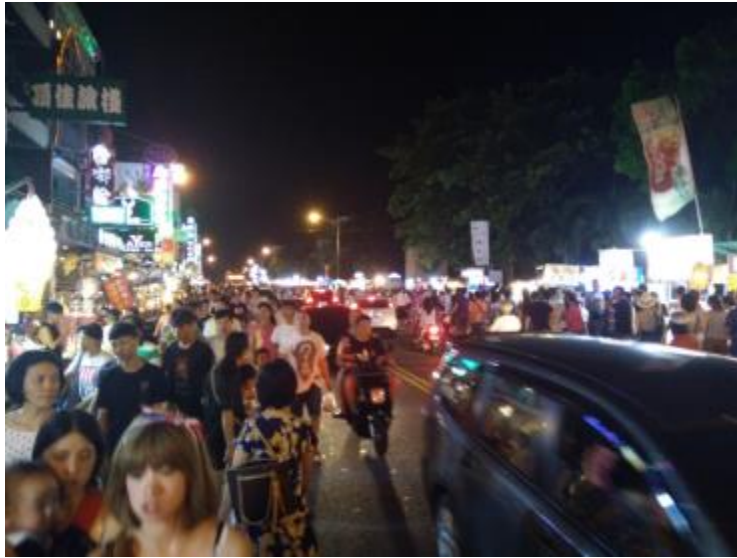
Gneča na night marketu v Kentingu.