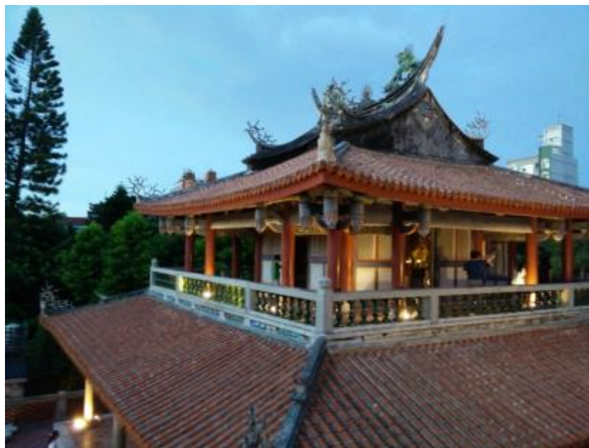
Utrdba v Tainanu.