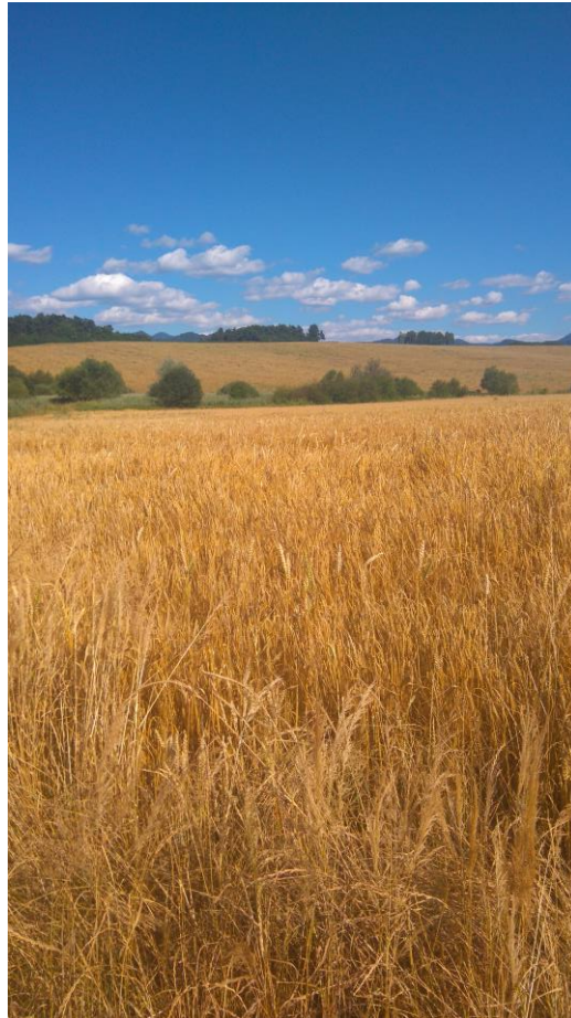
Tik za študentskim domom