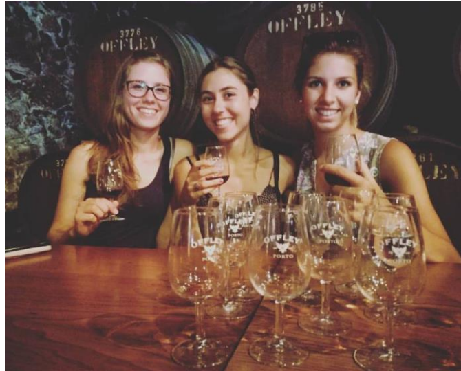
Degustacija portovca v vinski kleti.