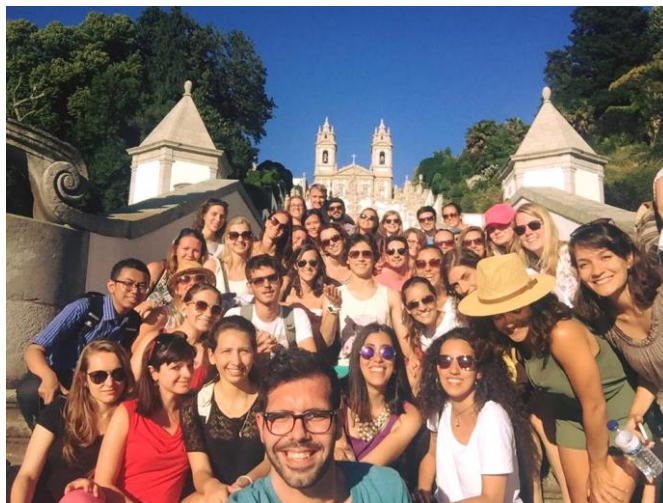
Izlet v Brago.