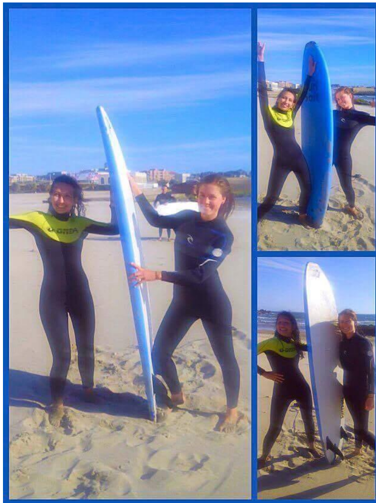
Tečaj surfanja v Matosinhosu.