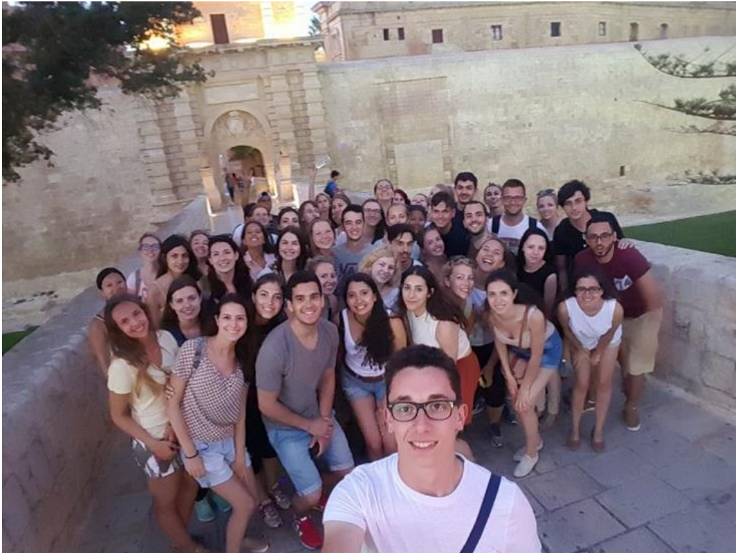
Slika 4: »Tresure hunt« v King's Landingu oz. Mdini