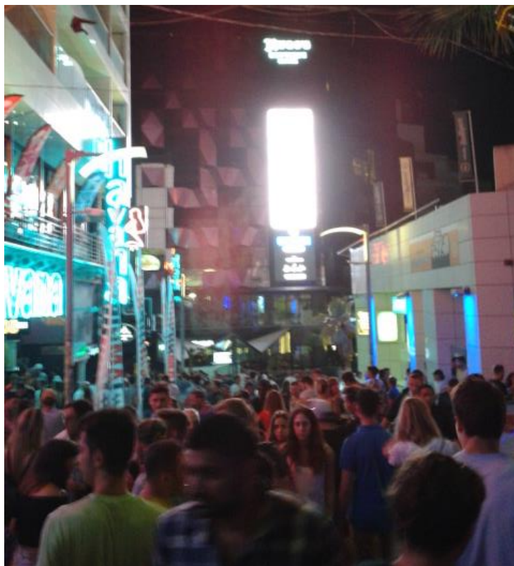
Slika 3: Paceville- polna ulica ljudi pred klubi

party, nogometni turnir, izlete na plaže. Večkrat smo šli skupaj ven v Paceville- četr polno klubov, kjer zabava traja vse do jutra, na Jazz festival, Festival vina, Festival piva, večerje,... Preostale dni pa smo s sostanovalci sami raziskovali otok, tako da smo res videli vse, kar se na otoku da videti 😊 Na vse aktivnosti je bil prevoz organiziran, na lastne izlete pa smo hodili z javnim prevozom