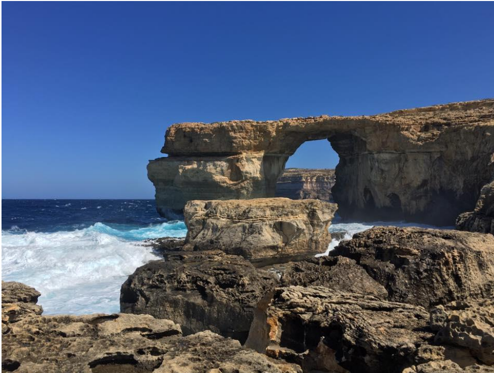
Slika 5: Gozo: Azure window