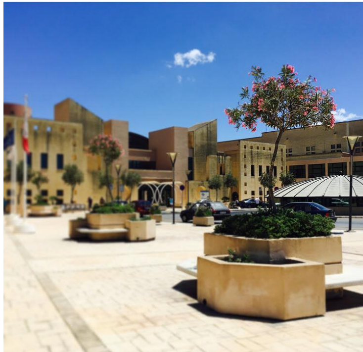
Slika 1: Glavni vhod v bolnišnico Mater Dei

Moja izmenjava je potekala v kraju Msida, ki je od glavega mesta Vallette oddaljen približno 15 minut vožnje z avtobusom. V tem kraju se nahaja malteška univerza, zraven nje pa tudi glavna bolnišnica v državi- Mater Dei Hospital. Se pa kraji na Malti, sploh tisti v okolici Vallette, držijo eden drugega, tako de je težko reči kje se en kraj konča in drugi začne. Malta je julija sončna, vroča in vlažna, zato je klima v bolnišnici, na avtobusu ali v trgovini zelo zaželjena.