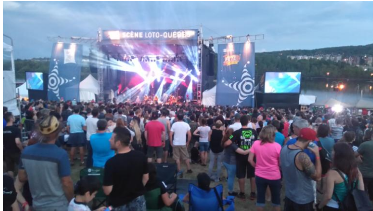
Sherbrooke divji žur