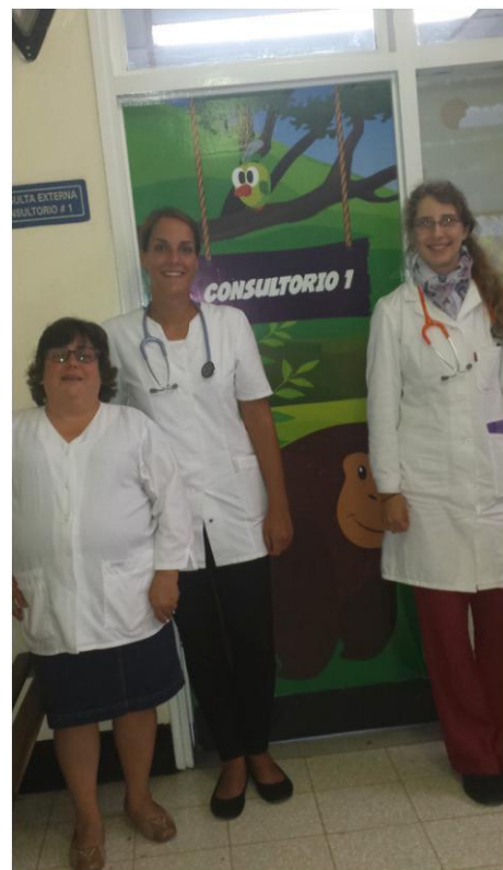
Z mentorico pred našo ambulanto

Mentorico sem si delila s študentko iz Avstrije. Vsak dan smo bile skupaj v njeni ambulanti na pediatrični kliniki. Bila je res zelo prijazna in se je trudila, da bi nama čim bolj razložila stvari. Vsak teden nama je dala za prebrati različne članke o katerih smo nato razpravljale. Res se je trudila, da nama bi predala kar največ znanja.