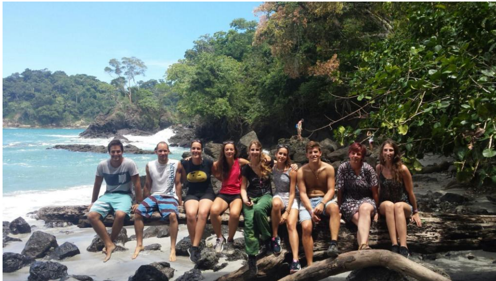
Z ostalimi študenti na vikend izletu v Nacionalnem parku Manuel Antonio

Socialni program naj bi bil na Kostariki organiziran, ampak zelo slabo. Pred izmenjavo ti pošljejo seznam kaj se bo dogajalo (1x med tednom in za vikende), ampak smo kmalu ugotovili, da nihče nima časa in volje da bi ga izvedel. Zato smo si program večinoma organizirali sami. Organizatorji so nam za vikende rezervirali hostle, kamor smo nato šli sami in se imeli prav super 😊.