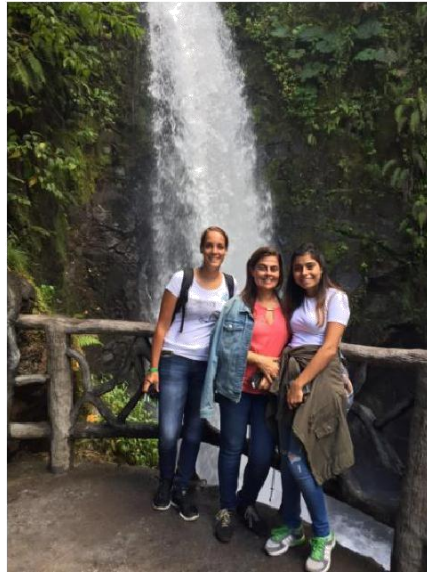
Na izletu s Kostariško družino