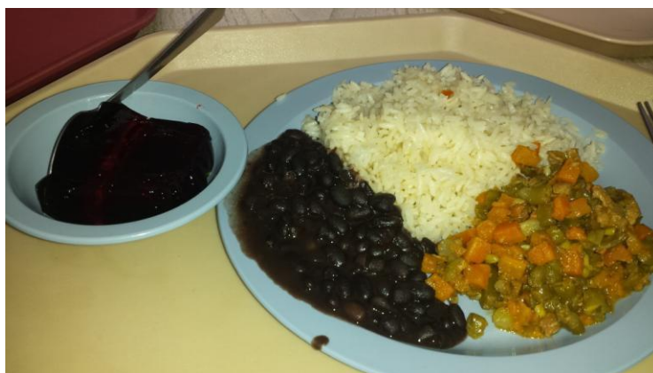
Hrana v bolnišnici (vsakodnevni riž in fižol)

Kosilo sem vsakodnevno zastonj jedla v bolnišnici. Ni bil ravno nek kulinarični presežek, je bilo pa čisto uredno. Kosila niso bila ravno obilna, tako da je bilo fino če si imel sabo še kakšno sadje ali čokoladko. Na Kostariki so vsi obroki po večini sestavljeni iz riža in fižola. Tako da če ne jeste riža, tam ne boste preživeli. Prav tako sem imela vsak dan zastonj pecivo in kavo. Večerjo pa sem jedla pri družini. Vsak dan nekaj drugega (pizza, takosi, sendviči, solate). Nikoli mi niso dovolili da jaz plačam ali kupim stvari v trgovini, tako da je bilo tudi to zastonj.