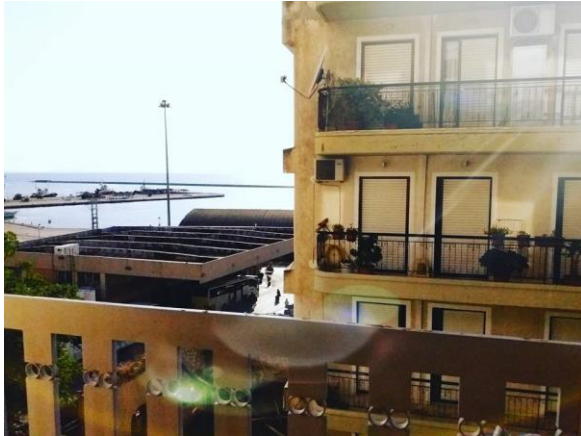
Pogled z balkona sobe

pospravljali 2x tedensko (zamenjali brisače, posesali tla, odnesli smeti in tudi kaj drugega – ja, moji cimri so izginile sladkarije, meni dva jogurta, in ne, nisva si kradli druga od druge :D). Kuhinje nismo imeli na voljo. Hotel je bil približno pol ure stran od bolnišnice, vendar so bile postaje za avtobus ali vlak zelo blizu.