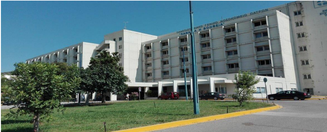
University hospital of Patras