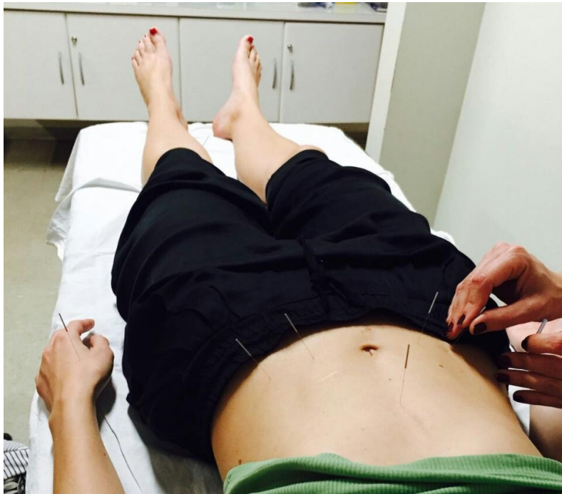
Slika 4 Izkušnja terapije z akupunkturo na lastni koži