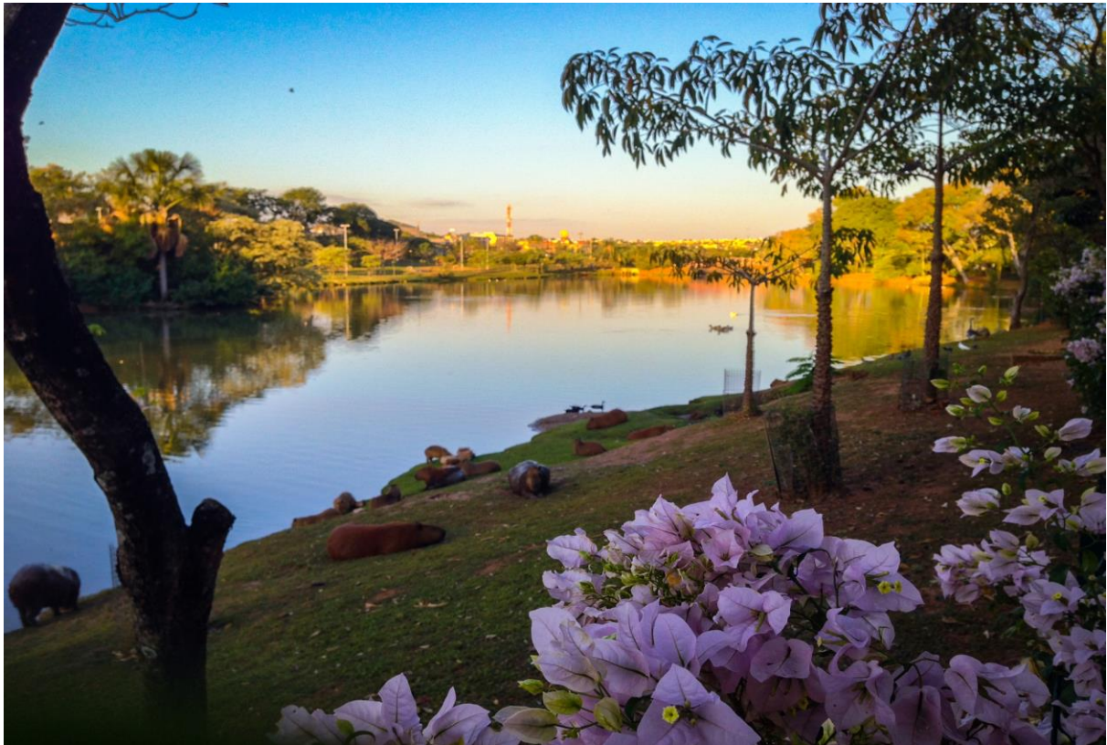
Slika 1 Kapibare ob jezeru v središču mesta Sao Jose do Rio Preto