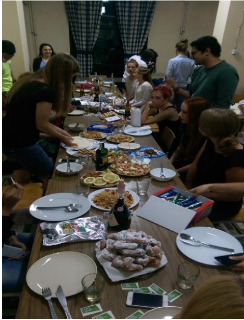
Slika 6: Mednarodna večerja