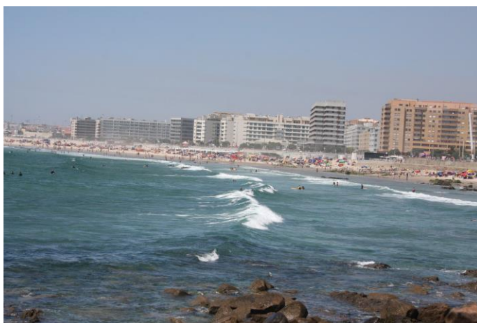
Slika 2: Moj najljubši del mesta- plaža Matosinhos