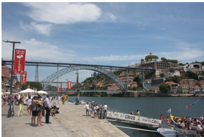
Slika 1: Reberia, najbolj obljuden del mesta, na drugi strani reke se nahajajo vsem znane kleti Portovca

Ostalih stroškov si nisem beležila. Je pa socialni program okoli 200 eur, če se odločite zanj. Za hrano in ostale stvari, je pa na vas, koliko boste zapravili. So pa cene v trgovini rahlo nižje od slovenskih, tako da toliko kot porabite doma boste tudi tam.