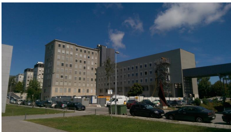
Slika 5: Bolnišnica Sao Joao