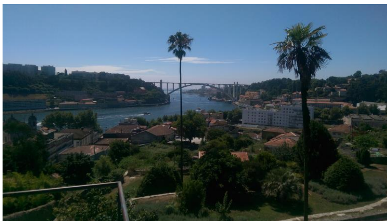
Slika 4: Še en pogled na reko Douro iz mestnega parka