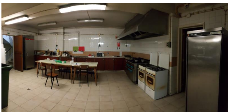
Slika 2: Skupna kuhinja.

Slika 1: Vsi predvideni časi so nerealni. V praksi hitreje kot v 50min ni do bolnice prispel nihče na izmenjavi.