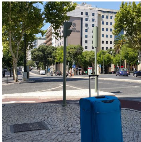
Slika 3: Ulice Lizbone.