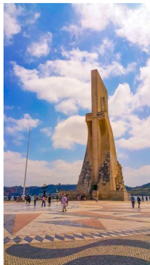
Slika 4: Padrão dos Descobrimentos