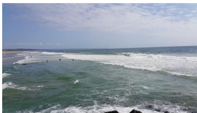
Slika 5: Costa da Caparica