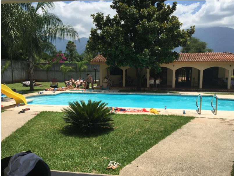
Slika 3: Pool party sobota.