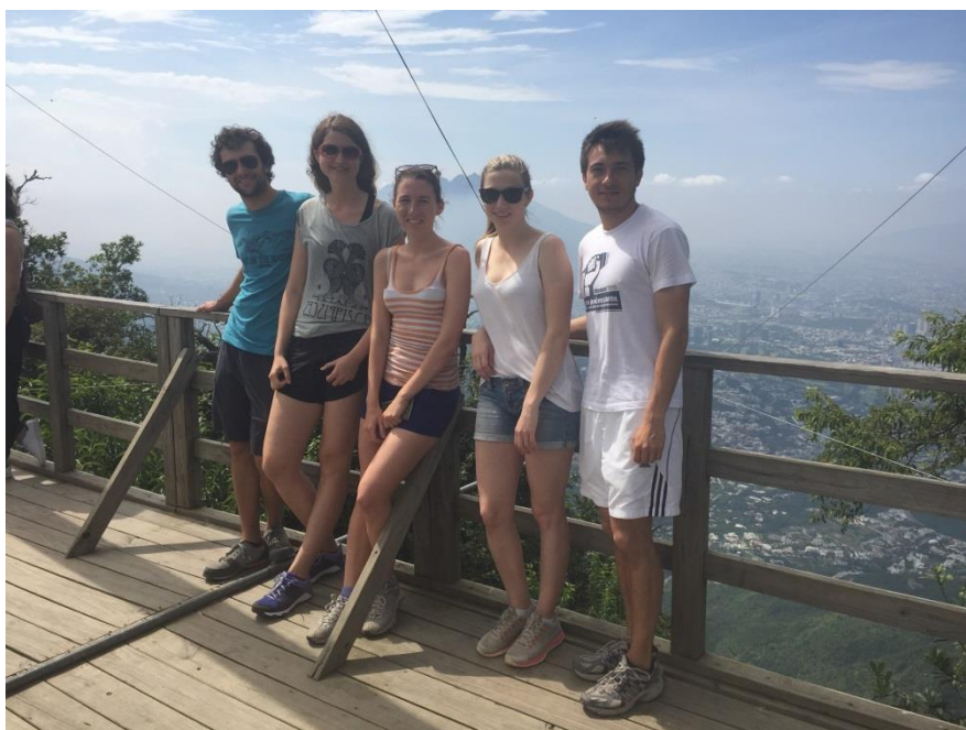
Slika 1: Izlet v Chipinque, naravni park v okolici Monterreya.

avtobusne karte, hostli, hrana in ostalo: okoli 1000€