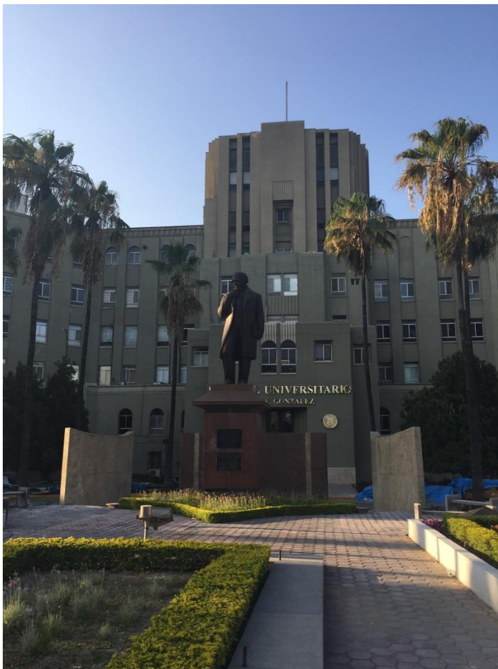
Slika 4: Univerzitetna bolnica.