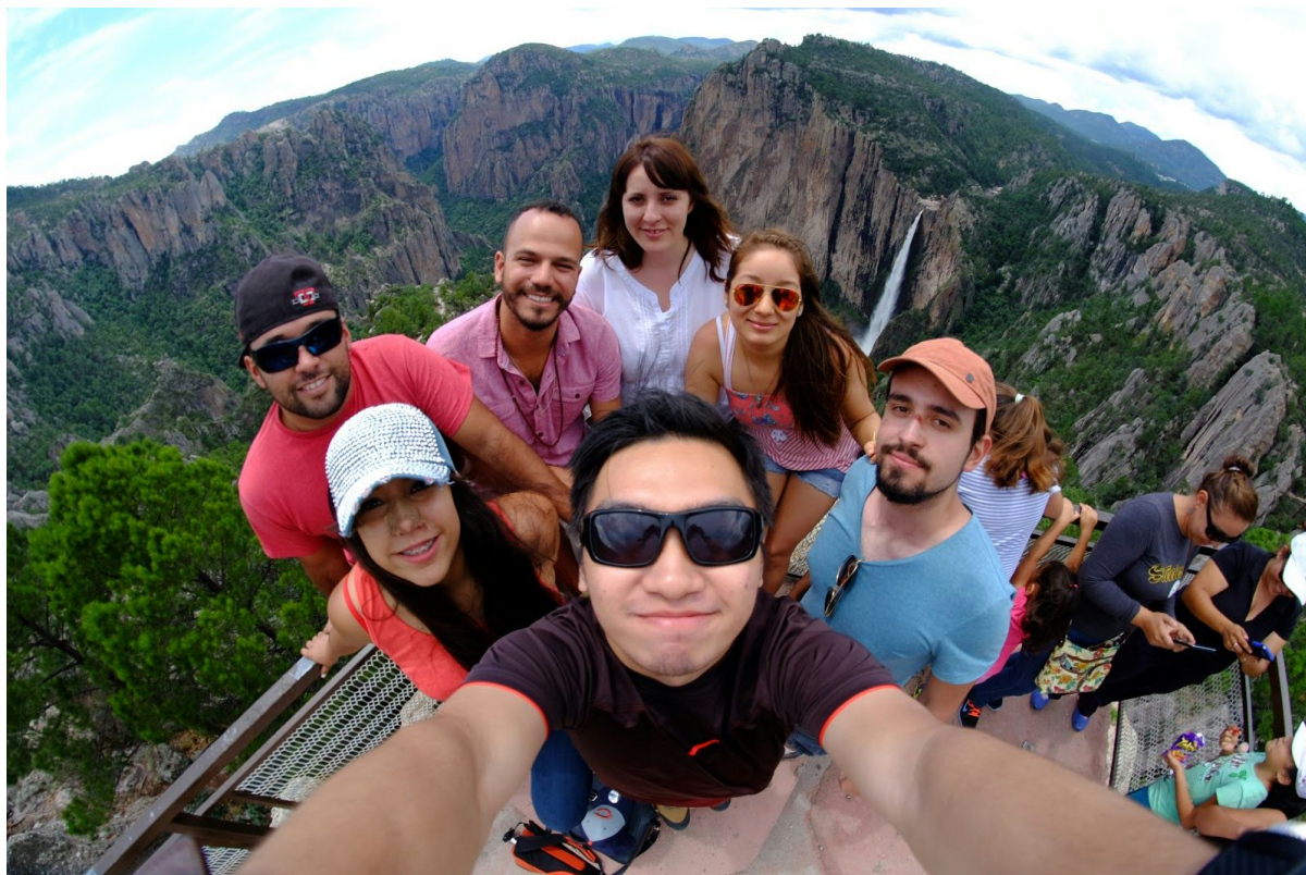
Slika 3: Študentje na izmenjavi z “vodičema” po La Sierrri, v ozadju Cascada de Basaseachi