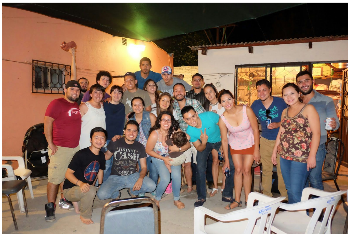
Slika 4: “Carne asada” na izletu v Parral