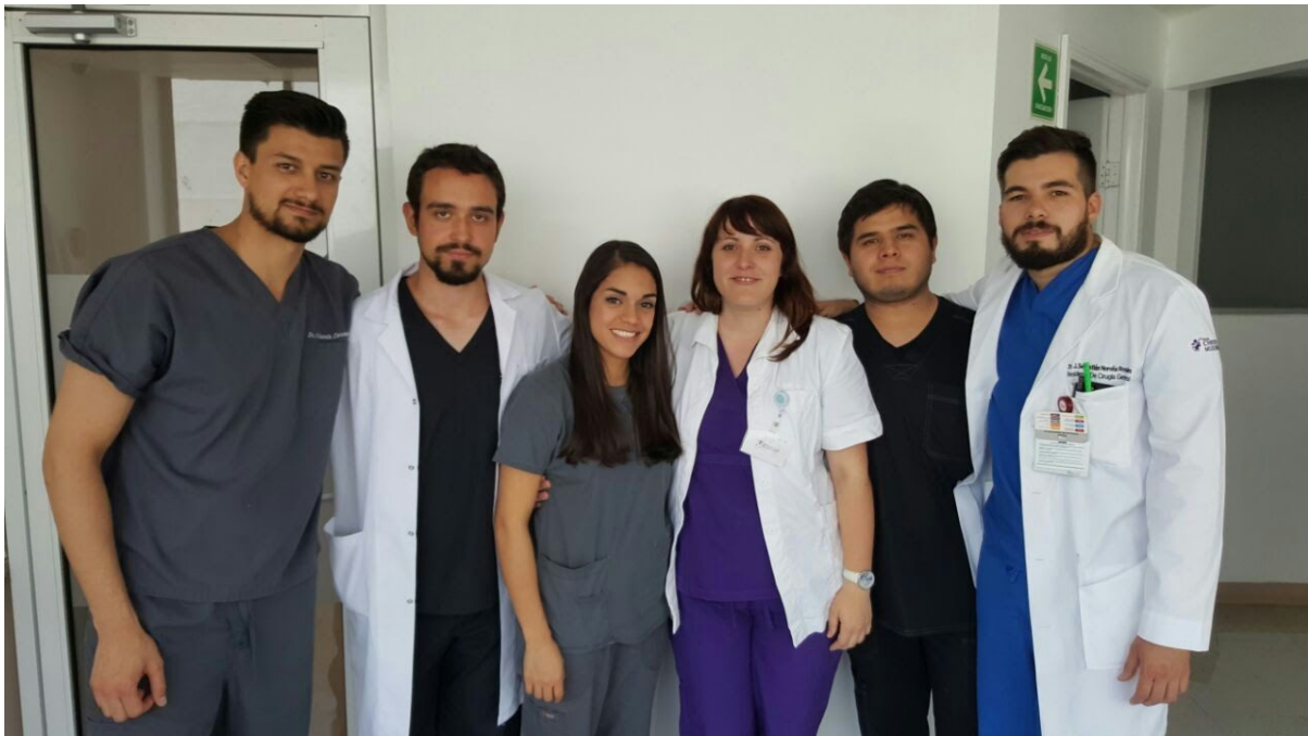
Slika 2: Pred zdravniško sobo s specializanti splošne kirurgije in njihovo pripravnico

Dejansko "delala", torej asistirala, rezala, šivala itd., sem manj, kot misli večina ljudi, ki so slišali, da sem bila v Mehiki, moja izmenjava je namreč potekala v privatni bolnišnici, kjer je nivo oskrbe za tamkajšnje razmere izjemno visok, pravzaprav skoraj primerljiv s slovenskim. Velja pa tam nenapisano pravilo, da starejši neprestano učijo mlajše, torej specialisti specializante, specializanti pripravnike in pripravniki študente, zato sem se največ naučila prav od pripravnice, ki je ta mesec delala na oddelku za kirurgijo, in mi je vse razložila, mi prevajala, kadar česa nisem razumela, ter mi tako omogočila tudi vključitev v kolektiv. Sicer pa so bili tudi v bolnišnici vsi izjemno pozorni (čeprav jih je v glavnem skrbelo, da nisem lačna, pridobivanje znanja je bilo na drugem mestu) in bolj ko so me spoznali, več so mi dovolili. Ko sem se poslovila, pa so itak vsi spraševali, kdaj se vrnem, medtem ko je sestra Pati celo potočila solzico ali dve. :)