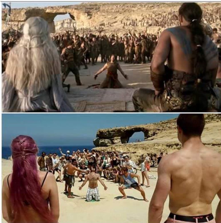
Azurno okno, otok Gozo – uprizoritev Dothraki poroke

Socialen program je bil zelo pester in zanimiv. Med vikendi so bili organizirani celodnevni izleti (izlet na otok Comino, na otok Gozo, potapljanje ...), cena se je gibala med 15 in 20 eur. Tekom tedna so bile organizirane različne druge aktivnosti (ogled Vallete, tradicionalna malteška večerja, večerni piknik, nogomet ...), takrat smo plačali samo prevoz – 4 eur.