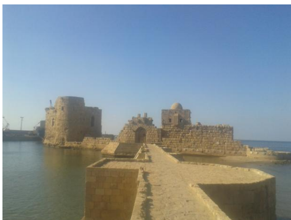
Slika 6: križarski grad v Saidi