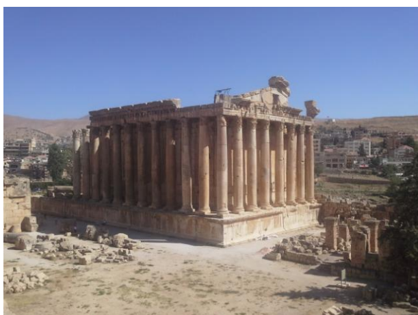
Slika 3: Dionizov tempelj v Baalbeku, središču "stranke" Hesbolah