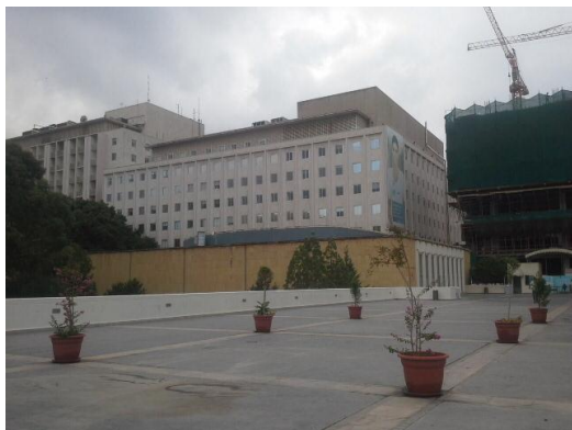
Slika 1: AUB Hospital - bolnišnica, zraven gradijo še nove zgradbe

hrano!). V Libanonu sem pustil še približno 700-800€ za potovanja, prevoze, ogleda, pijačo, večerje, kosila itd. Beirut ni poceni, cene pijače & hrane so precej višje kot pri nas.