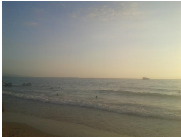
Slika 4: plaža v Byblosu