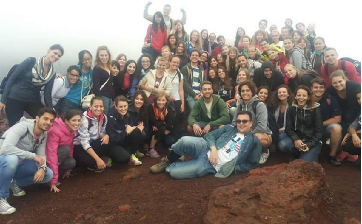
Izlet na Mt. Etna.