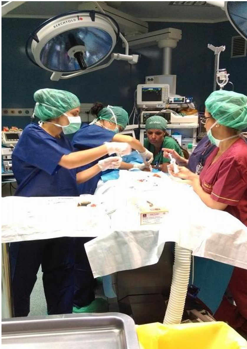
Operacija na oddelku otroške urologije.