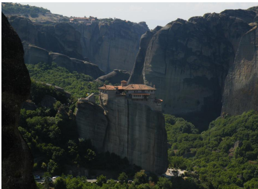
(Meteora, pogled iz enega samostana na drugega)

dogodek ali pa kam drugam. Isto velja za vikende, lahko smo šli po svoje v lastni režiji ali pa z organizatorji.