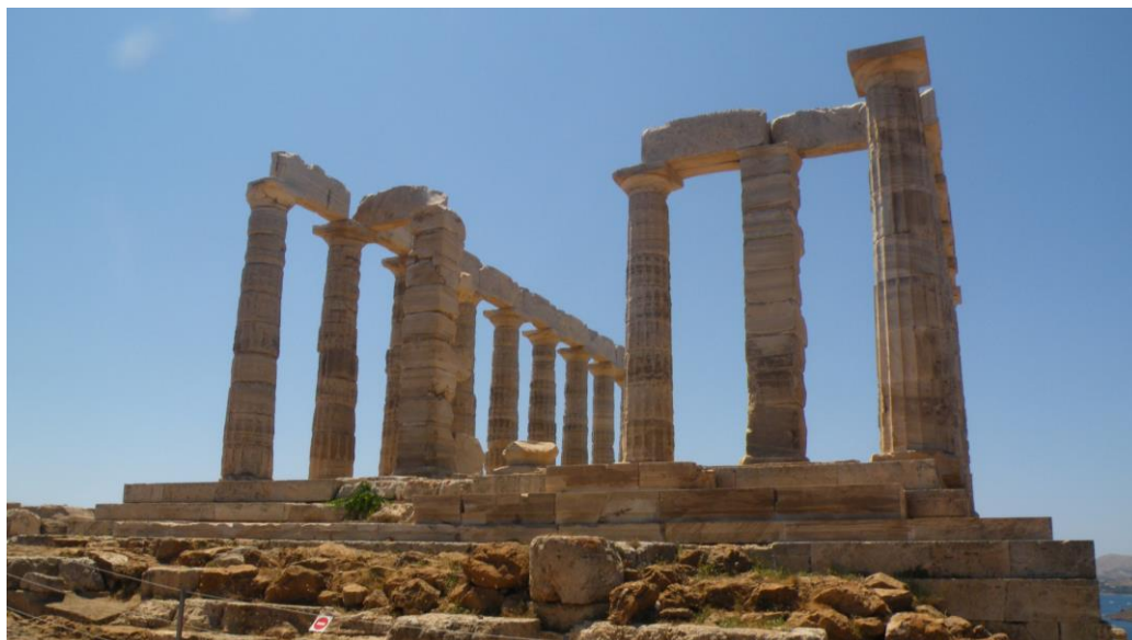
(Pozejdonov tempelj, Cape Sunio)

Družabni program: national social program (izlet za vikend na Paros): 160 evrov