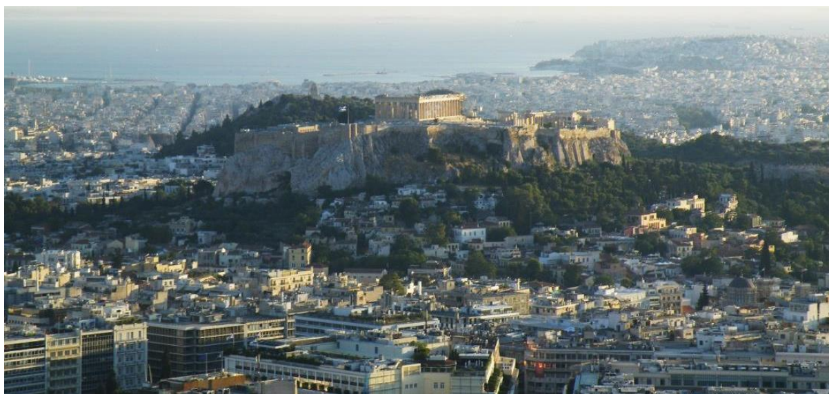
(pogled na Atene z enega izmed hribčkov v mestu)

Atene so glavno mesto Grčije in gledano s perspektive "Kaj početi s popoldnevi in med vikendi" najboljša izbira. Tudi za izmenjavo je najboljša, ker so seveda bolnišnični/raziskovalni centri primerni glavnemu mestu in se da veliko več videti. Turistično imate veliko stvari na ogled in tudi če želite potovati v druga mesta, so vse povezave iz Aten (trajekti do otokov, vlaki/avtobusi do celine). Mesto je veliko, tako da kamorkoli želite iti - rabite veliko časa (do plaže recimo rabite slabo uro). Grki so navajeni turistov in angleščina ni problem, so pa tudi vsi zelo prijazni in ustrezljivi. Turistov je ogromno med poletjem, v centru sploh – če želite grško avtentičnost, boste morali odpotovati v kakšno manjše mesto ali pa reči kateri izmed kontaktnih oseb, da vas peljejo na pravi kraj.