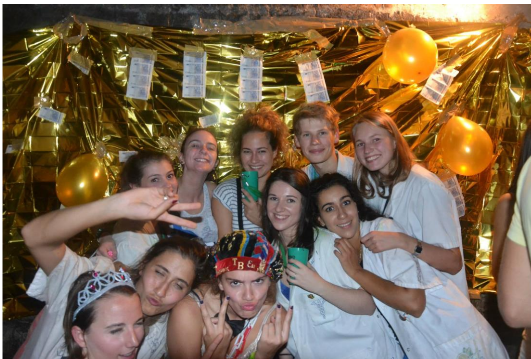
Francoska verzija zabave v Pajzlu, ki je še veliko bolj umazana in divja od naše različice.