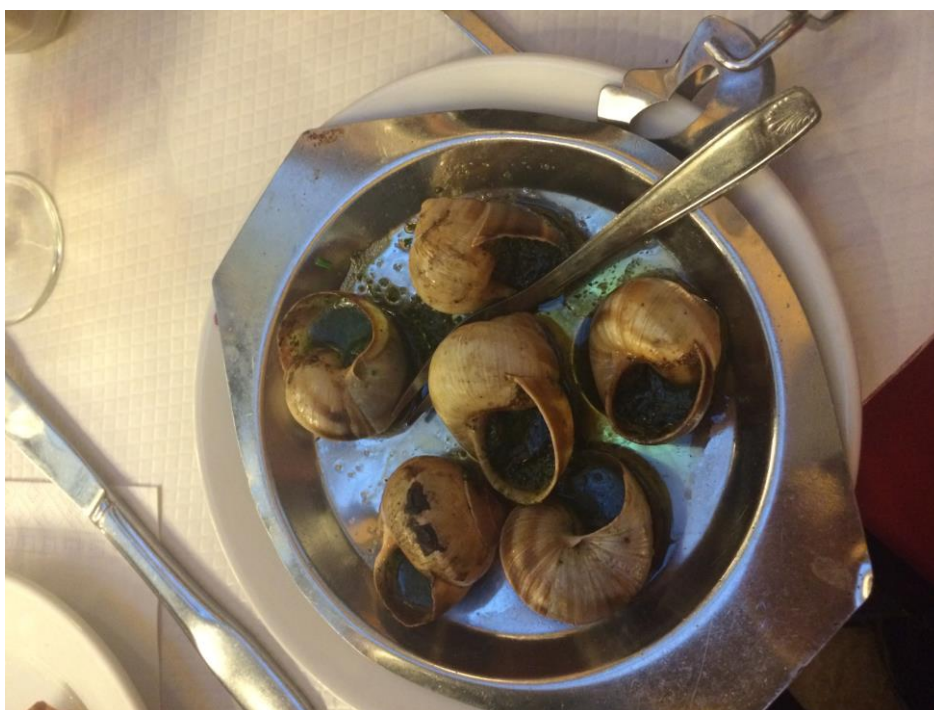
Francija je vendarle slavna po svoji kuhinji in ne moreš se izogniti nekaterih njihovih tradicionalnih jedi kot na primer quiche Lorraine, fois gras in les escargots, ki so na sliki.