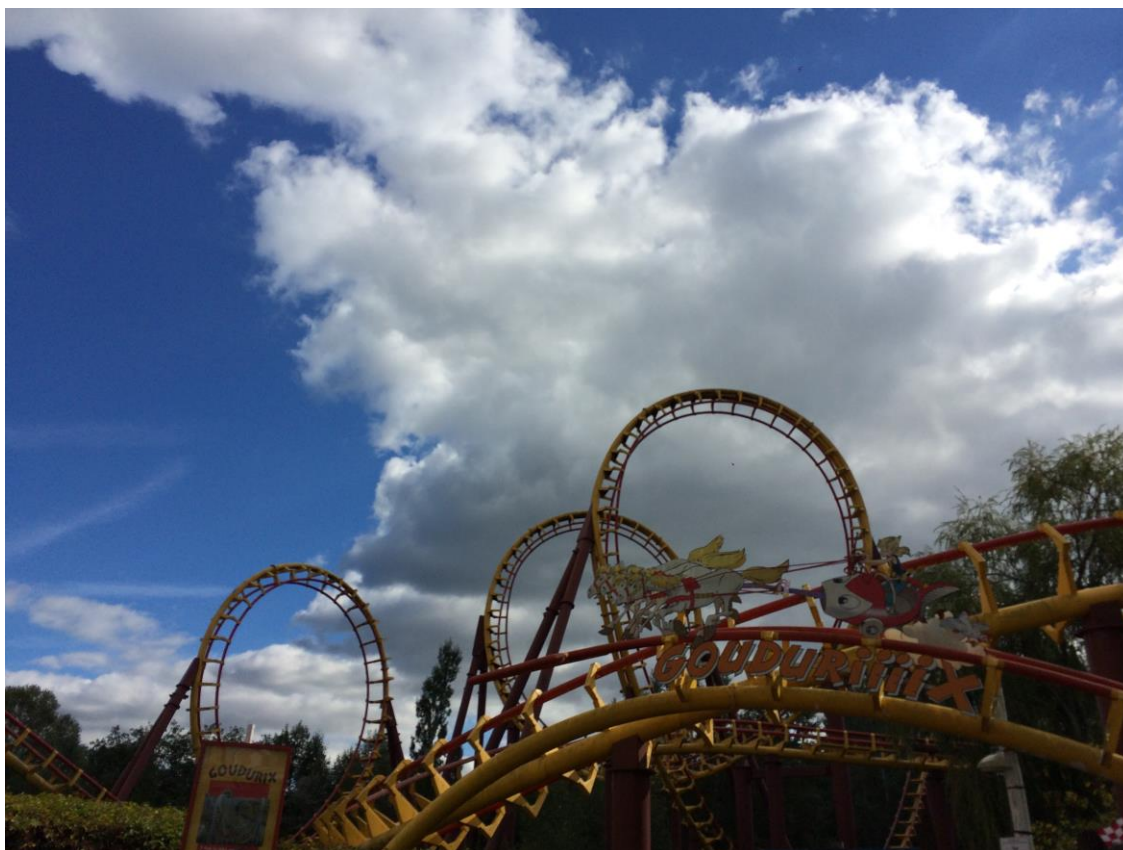
Vlakci smrti v parku Asterix, najboljši za preganjanje mačka jutro po medicinski žurki.