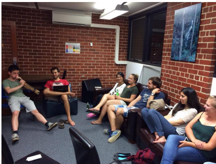
Slika 1: Utrinek iz študentskega doma

Čeprav je bilo treba za to nastanitev doplačati 165 avstralskih dolarjev (dobrih 100 evrov), se mi zdi da se je splačalo. Tukaj je bilo še nekaj drugih študentov na izmenjavi, s katerimi smo se večino časa družili. Pred izmenjavo so nam ponudili možnost nastanitve pri družinah, ki bi bila brez doplačila a na neznanih (in potencialno še bolj oddaljenih) lokacijah.