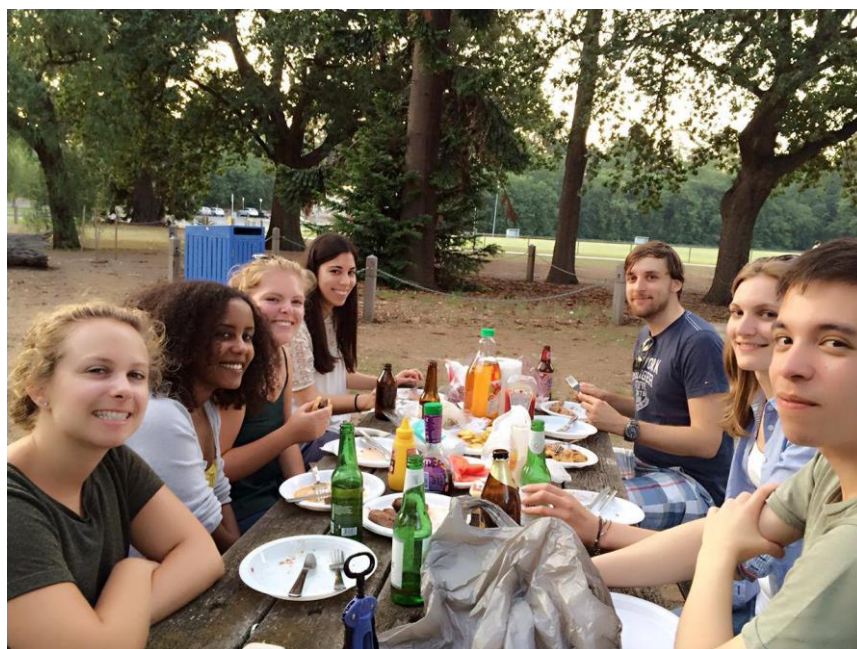
Slika 3: Piknik s sostanovalci

Organiziranega socialnega programa ni bilo. Družili smo se največ z ostalimi prebivalci študentskega doma, kar se je izkazalo za prav prijetno: 2x smo organizirali piknik, večkrat smo šli v mesto na pijačo ali nočno tržnico. Skupaj smo šli celo na izlet na Great Ocean Road.