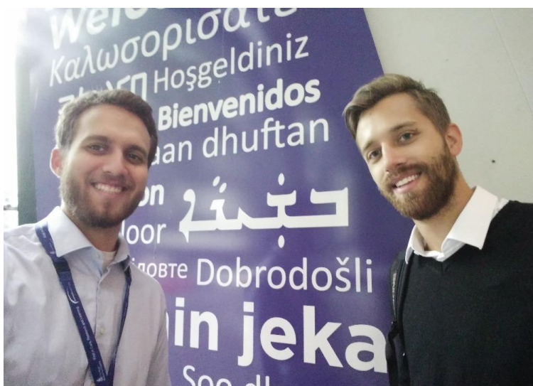
Slika 2: Že na vhodu v bolnico se vidi multi-kulti